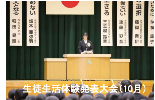
生徒生活体験発表大会 (10月)