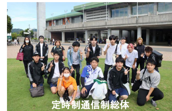
定時制通信制総体