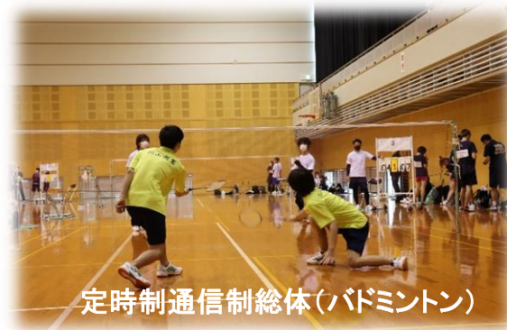
定時制通信制総体(バドミントン)