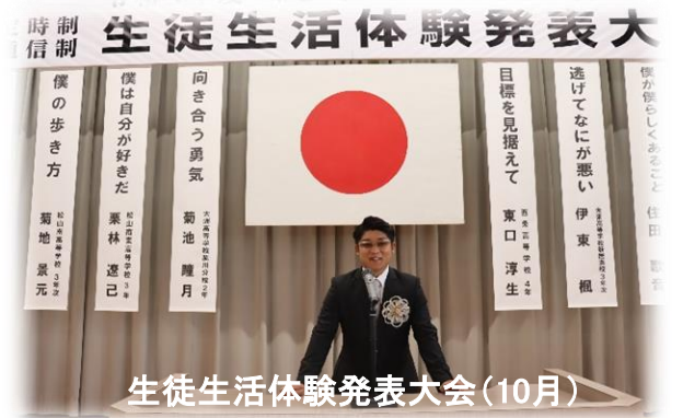
生徒生活体験発表大会（10月）